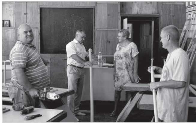
У ЗОШ №12 завершується заміна системи водопроводу

У підшефній ПАТ «АЗОТ» ЗОШ №12 закінчуються роботи з повної заміни системи водопроводу і каналізації, на що, за сприяння депутата від ВО