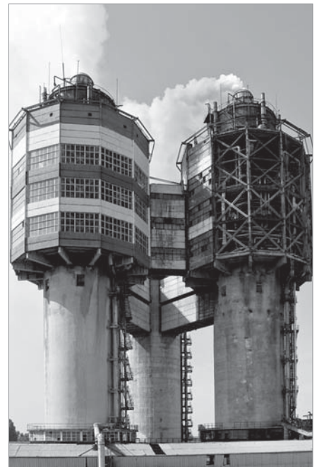
Гранбашти цеху з виробництва аміачної селітри М-9

Працівники цехів М-9 та господарської діяльності «Азоту» допомагають під-